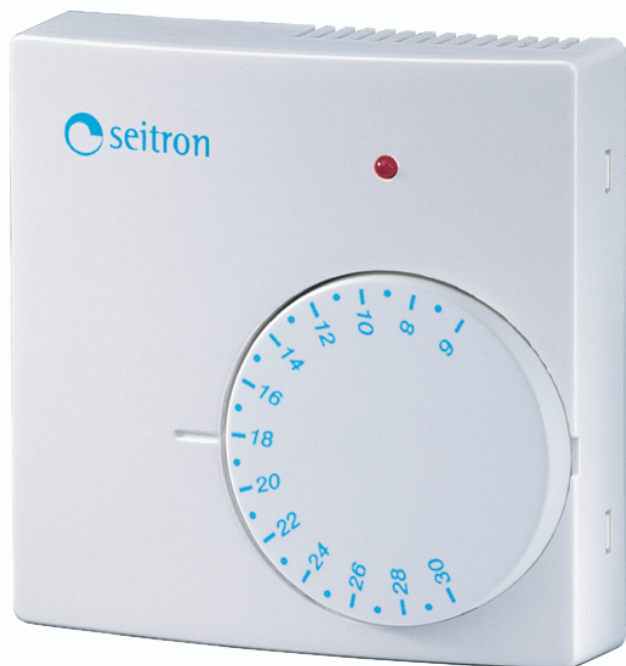
Рис.1 Внешний вид

http://www.seitron.ru e-mail: seitron@kipa.ru